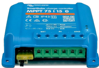
Controlador de carga SmartSolar MPPT 75/15