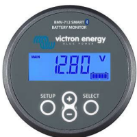
Detección de Bluetooth BMV-712 Smart Battery Monitor